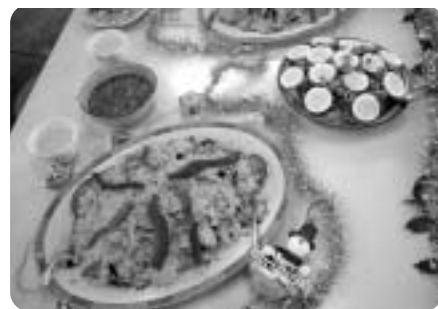
美味しそうに出来ました

今回のブラジル料理では、日本では珍しいキャッサ芋の粉末やうずら豆を利用した料理を作りました。また、クリスマスが近いということもあり、クリスマスのご飯(アホス・デ・ナタオ)を作り、テーブルもクリスマス色にコーディネートして、ブラジル音楽を聴きながら楽しみました。