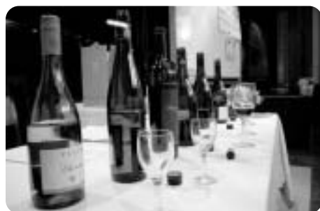
セミナーで紹介したワイン