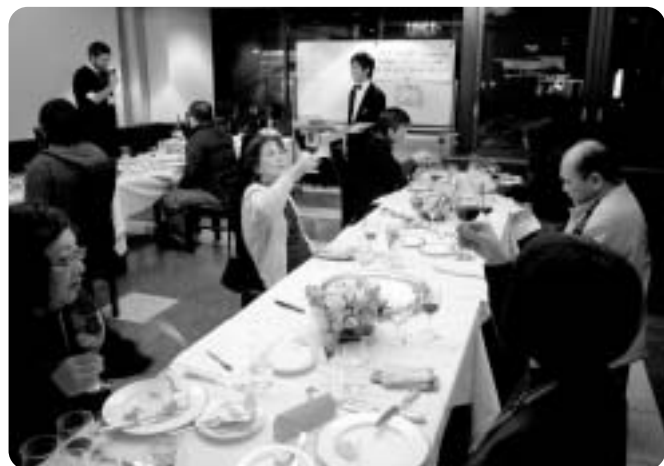
説明を聞きながら色と香りの確認をする皆さん