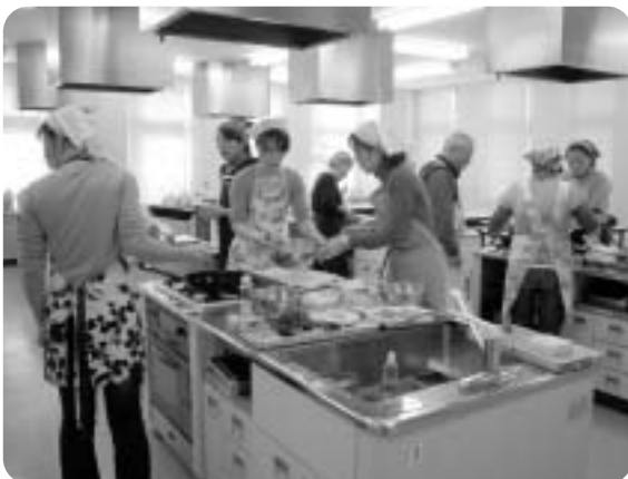
調理をする参加者の皆さん