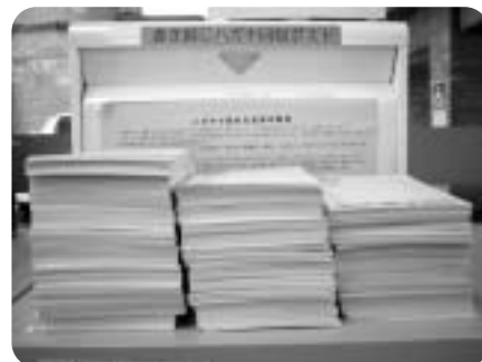
回収されたハガキ

引き続き、市役所本庁舎2階情報公開コーナーと図書館において、書き損じハガキの回収を実施していきますのでよろしくお願いします。